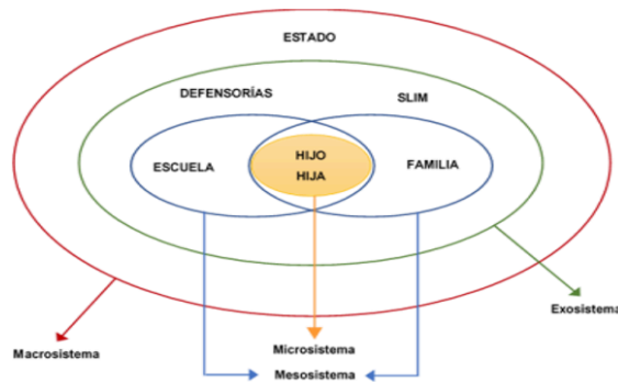
Gráfico 1: Sistemas que influyen en la educación de los hijos

Fuente: Adaptación del modelo de Bronfenbrenner (1987).