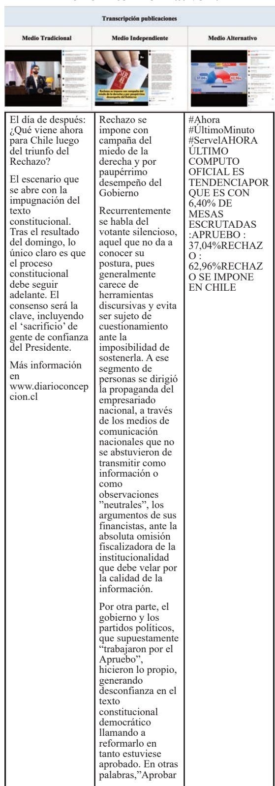
Tabla 9. Publicaciones realizadas por los medios en el hito informativo 4.