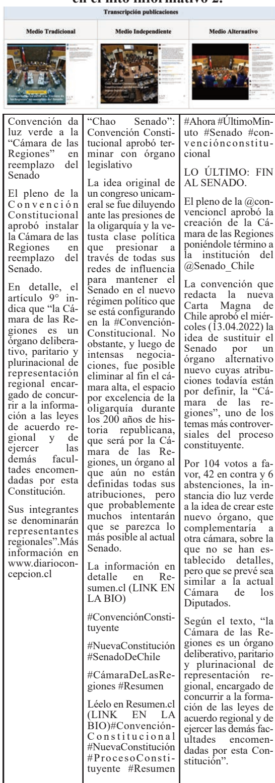
Tabla 5. Publicaciones realizadas por los medios en el hito informativo 2.