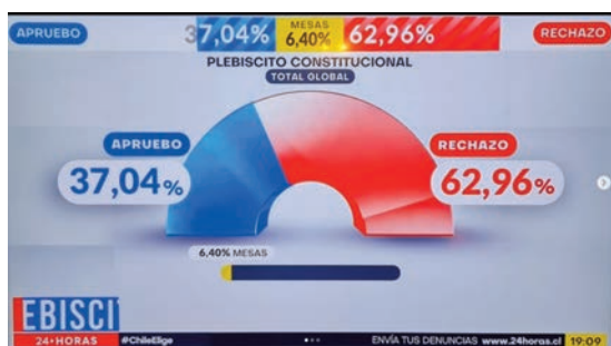
Ilustración 2. Publicación en medio alternativo sobre el Hito Informativo N°4.

Por último, el medio alternativo si bien presenta notas informativas con información veraz, correcta redacción y ortografía, sin partidismo o valorizaciones personales, destaca por la falta de uso de fuentes o expertos, no utiliza links a su página web, y por la utilización de recursos visuales que no fueron producidos por el mismo medio. Ejemplo de esto último es cuando en el Hito N°4 utilizan una imagen proveniente de otro medio de comunicación: