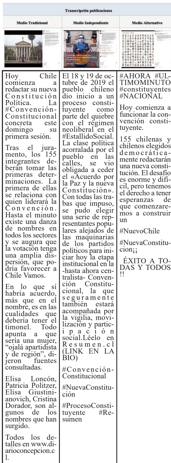
Tabla 3. Publicaciones realizadas por los medios en el hito informativo 1.

El 4 de julio de 2021 se dio inicio a la Convención Constitucional en Chile, en una sesión inaugural que tardó más de dos horas en comenzar debido a las distintas movilizaciones que tuvieron lugar en el exterior del edificio del ex Congreso Nacional de la ciudad de Santiago. En dicha oportunidad los 155 convencionales constituyentes electos (78 hombres y 77 mujeres) aceptaron el cargo de redactar una propuesta de texto para una Nueva Constitución Política.